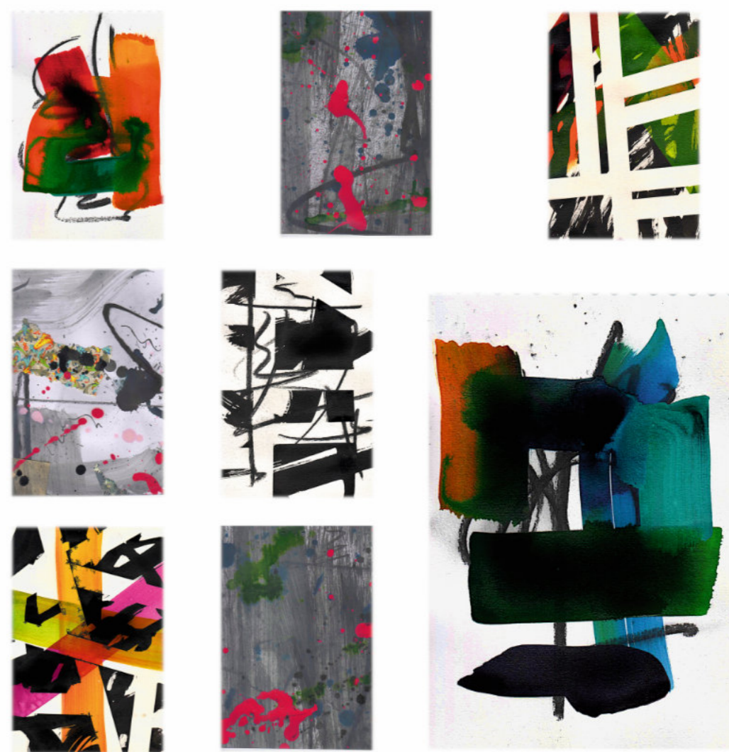
Träume und Blätter im Séparée | Auswahl aus 111 Blättern Tinte, Acryl, Lack, Kohle auf Papier | jeweils 15 x 10 cm | 2023